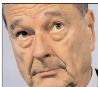
Jacques Chirac... et après ?

Cancer en Vierge ou en Capricorne. Est-ce à dire qu'aucune crise du logement, activisme des partis pour un retour aux traditions royalistes ne soit ressentie ? (Cancer) Qu'il n'y ait eu aucune crise dans le monde professionnel (Vierge) ou politique (Capricorne) ? Bien sûr que non. Au contraire parfois. Mais ce n'est pas le plus caricatural de nos textes constitutionnels.