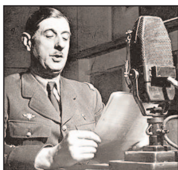
Général de Gaulle

naturellement le verbe et l'intellect. Mais point trop n'en faut. Or 22 cabinets ministériels vont se succéder en douze ans d'existence. L'échec est donc patent : l'instabilité ministérielle semble signifier que l'on a beaucoup parlé, réfléchi et finalement peu agi. Il faut encore ajouter l'influence de la Lune Noire en Sagittaire, même en politique intérieure. En effet, la constitution de 1946 avait été prévue pour fonctionner avec des majorités solides. Or, les communistes vont en pâtir à la suite du désaccord entre les alliés occidentaux et l'U.R.S.S, ce qui mettra fin au tripartisme (MRP - SFIO et PC). Pouvait-on se douter que le système s'effondrerait brutalement ? Le fait est qu'Uranus est à un orbe de 8° du Nœud Nord.