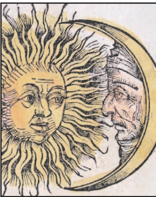
Alors, mal luné?